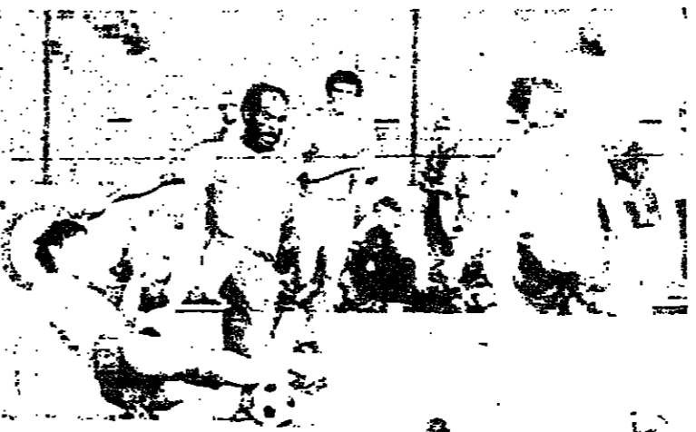
من الارشيف .. لقطة في مباراة اسراييل مع السويد والتي جرت في استكهولم وانتهت بالتعادل 1:1 ترى هل سيفوز المنتخب الوطني الاسرائيلي اليوم ؟